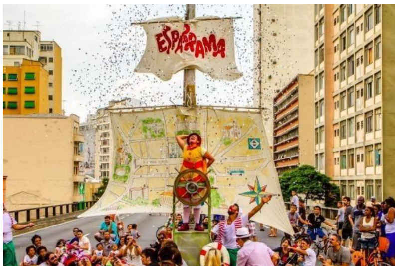
Fotografia 2 - Cena final do espetáculo Minhoca na Cabeça . Imagem de Adriano Choque. Fonte: Acervo do Grupo Esparrama.

A peça narra a história de uma menina do interior que, ao mudar-se para a cidade, sente medo de brincar na rua. As “minhocas” que habitam sua cabeça simbolizam os temores produzidos pelo espaço urbano, mas, com o apoio de amigos, ela aprende a enfrentá-los. O desfecho é marcado por uma cena profundamente simbólica: o Minhocão é transformado em barco por meio de elementos cênicos acionados com a participação das crianças. Uma âncora é içada, boias são lançadas ao público, uma vela se ergue, e, de modo triunfal, a menina proclama: “Navegar!”. Nessa ação, o grupo de certa forma reivindica o direito da criança de ocupar o espaço urbano, convertendo a cena em um manifesto estético-político ao inscrever simbolicamente esse corpo em perspectiva iminente de navegar pela cidade.