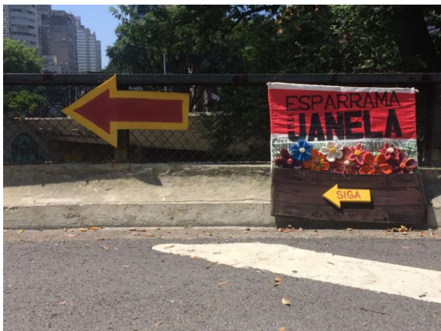
Fotografia 6 - Placa indicando o Teatro de Janela.

Democratizar o acesso à arte e aos meios de produção artística é urgente para fortalecer a liberdade de expressão e o direito universal à participação cultural. Mais do que privilégio, a expressão artística deve ser entendida como direito fundamental, capaz de potencializar processos educativos voltados à formação crítica dos sujeitos e à ampliação da democracia, abrindo novos portos de vista.