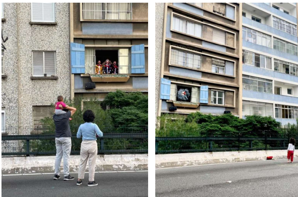
Fotografia 3 - Registros do espetáculo Navegar durante a Trilogia de Janela .

se encontram, denunciam injustiças, elaboram pensamento crítico e projetam novas formas de habitar a cidade.