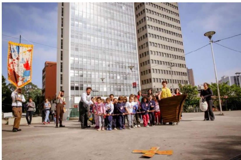
Fotografia 4 - Crianças navegando com o Grupo Esparrama pela cidade.

O Projeto Navegar , desenvolvido ao longo de um ano e quatro meses a partir da provocação Com que cidade sonham as crianças? , mobilizou 25 artistas em um processo inédito na história do Grupo dada a amplitude e a intensidade da experiência. A vasta quantidade de material sensível, oriundo das escutas infantis e das vivências nos territórios, exigiu do coletivo um esforço rigoroso de curadoria e de transposição estética, confrontando-o com dúvidas, limites e contradições inerentes à própria criação. Tal dimensão revela, em sua complexidade, o caráter dramático da criação artística, conforme compreendido por Vigotski. Para o autor, “[...] o drama realmente está repleto de luta interna impossível nos sistemas orgânicos: a dinâmica da personalidade é o drama” (Vigotski, 2001, p. 35). Assim, tanto a produção artística, quanto a formação das funções psíquicas superiores, não se dá em meio à estabilidade, mas no interior de tensões e conflitos mediados socialmente. Nesse horizonte, a arte é compreendida como “técnica social do sentimento” (Vigotski, 1999), processo pelo qual emoções e experiências são reelaboradas por meio da mediação simbólica. O Projeto Navegar evidencia essa concepção sobre arte ao revelar que a criação artística não é produto isolado de indivíduos, mas resultado de um entrelaçamento histórico, social e cultural que, ao transformar a experiência coletiva em linguagem cênica, reafirma a arte como dimensão social de produção de sentidos compartilhados.