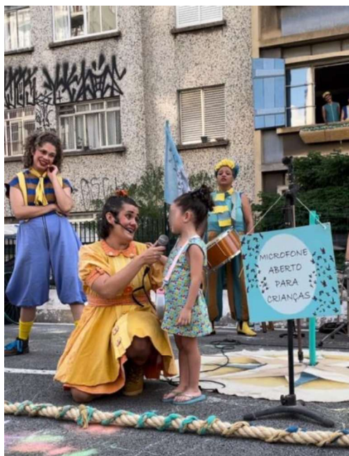
Fotografia 5 - Microfone aberto para crianças.

Essa perspectiva crítica aproxima a poesia de Barros do teatro produzido pelo Grupo Esparrama. Se no imaginário social espera-se que o teatro para crianças se restrinja a narrativas simplificadas e elementos cênicos estereotipados, o grupo subverte essa expectativa ao assumir uma linguagem estética e política que reconhece as crianças como sujeitos capazes de refletir criticamente e de agir sobre a realidade dentro de suas possibilidades. O grupo não se limita a falar sobre a cidade e as crianças apenas no plano do discurso, não obstante cria condições concretas para que essa relação aconteça, como no recurso do microfone aberto. Nesse dispositivo, as crianças tinham a possibilidade de expressar livremente suas percepções sobre a cidade ou qualquer outro tema, diante de um público predominantemente adulto. Essa escolha deslocava a função do espetáculo: já não era necessário explicar sua metodologia ou justificar seu caráter participativo de criação, pois a própria voz da criança, ecoando no Minhocão, forjava a escuta como princípio cênico e ético.