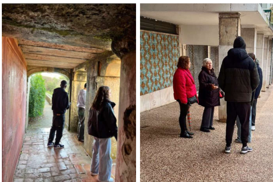
Fotografia 5 – À esquerda: saída de campo nos jardins da Quinta Real de Caxias, 2025. – À direita: saída de campo com turma da EBS Amélia Rey Colaço a entrevistar moradores 2025 - tema: a vida quotidiana das pessoas de Carnaxide.

O percurso das oito oficinas segue uma lógica de descoberta progressiva, do reconhecimento pessoal e coletivo do olhar até a montagem de uma exposição final. A primeira sessão é de apresentação e de primeiros olhares, introduz o projeto e propõe exercícios de fotografia participativa, como o “caça ao tesouro”, explorando o olhar individual e a multiplicidade de perspectivas dentro do grupo, estabelecendo o ABC da fotografia (noções simples de enquadramento e intenção, de luz, foco e plano). No segundo encontro, cada turma/grupo escolhe o tema e a comunidade a retratar, definindo assim o fio condutor da narrativa visual; nesta segunda sessão é lançado o primeiro desafio: olhar o território com curiosidade e sentido crítico. As sessões seguintes trabalham noções de literacia visual, interpretação de imagens e composição fotográfica; explora-se um mapeamento cultural e afetivo de seus quotidianos e território - o que é património para mim? - e abordamos técnicas, materiais e formas de apresentação ou exposição. É escolhido coletivamente o tema e o espaço, preparada a abordagem.