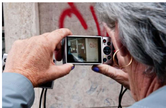
Fotografia 9

Trabalhar com a população sénior e incluir quem habitualmente não trabalha com ferramentas artísticas, resulta em processos participativos que são puro prazer para a equipa 4Change. São 10 anos depois d'O Meu Bairro, primeiro projeto de diagnóstico participativo e intergeracional implementado pela 4Change em parceria com a FOS ONG e a Ana Filipa Flores na Ajuda. E 4 anos depois do Namorar à janela do Mundo, uma campanha pelos direitos séniores, que se centrou no programa de capacitação em literacia digital para séniores - e de formação em direitos humanos, privacidade e afetos para profissionais que trabalham com a população mais sénior dos Bairros de Intervenção prioritária lisboetas, em plena pandemia.