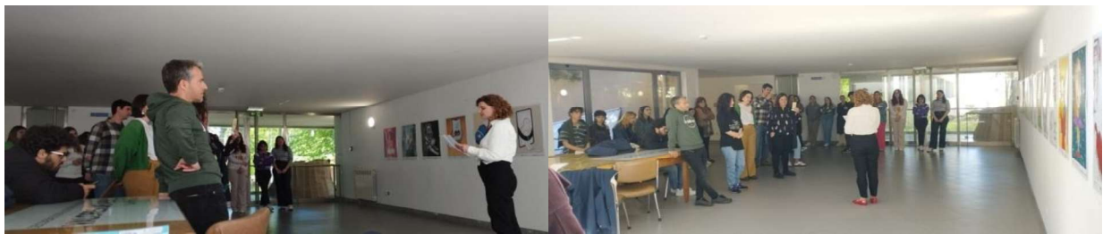
Figura 13 e 14 – Inauguração da exposição “Abril os olhos: Desconexão Digital no Ensino Superior”.

Embora a estrutura apresentada resuma de forma clara e organizada os momentos fundamentais do projeto, é importante destacar que esta sequência nem sempre correspondeu exatamente à dinâmica real desenvolvida em sala de aula. Vários estudantes encontraram dificuldades iniciais para chegar a soluções interessantes, o que tornou essencial o papel do professor na orientação e no fornecimento de “feedback” contínuo. Além disso, o processo foi marcado por uma ampla experimentação, uma vez que os estudantes testaram diferentes soluções e técnicas até alcançar os resultados finais. Também foi necessário voltar à investigação em diferentes fases do processo, uma vez que novas ideias foram surgindo, alimentando diálogos constantes durante a criação das ilustrações. Assim, embora o esquema apresentado retrate globalmente o percurso do projeto, trata-se de uma estrutura flexível, adaptada sempre que necessário para atender às reais necessidades e especificidades do trabalho em contexto de investigação artística.