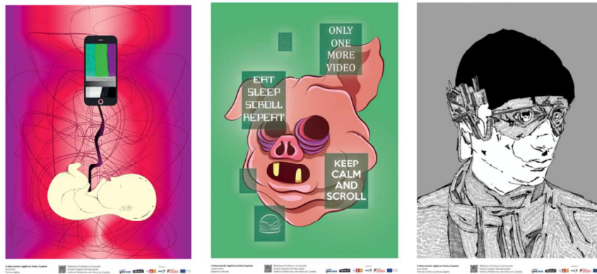
Figura 4 – Íris Santos, sem título, pintura digital.