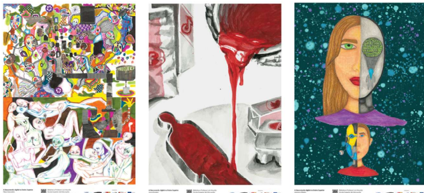
Figura 7 – Filipa Saavedra, tinta e marcadores sobre papel.