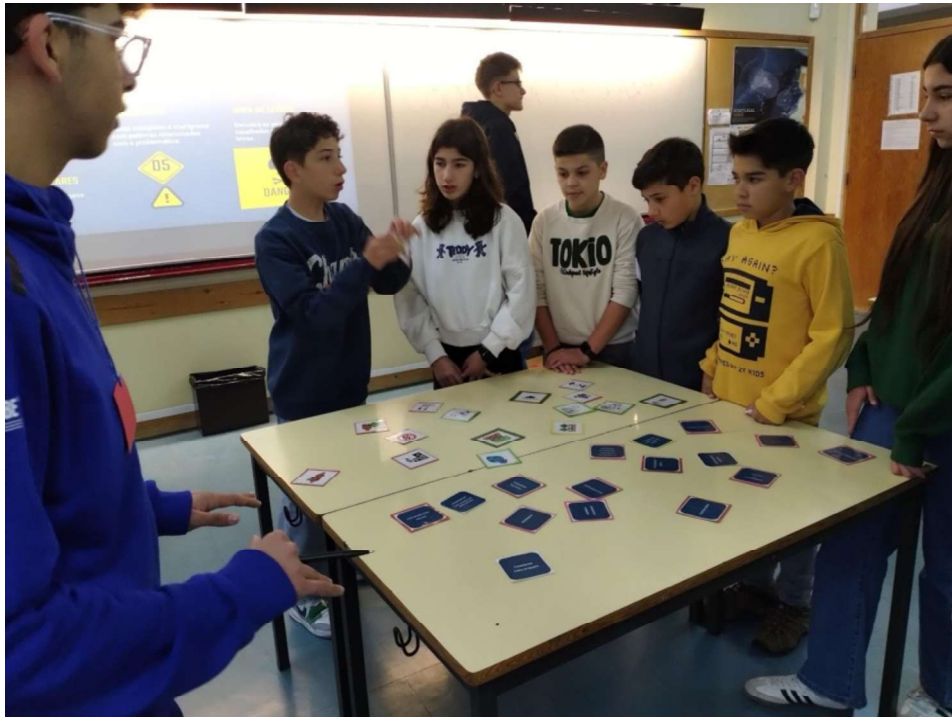
Fotografia 9 - Estação Jogo da Memória: alunos/as de 9º ano a dinamizar uma atividade para colegas de 6º ano.

Quis-se experimentar a metodologia de formação de educadores/as de pares neste contexto e desafiaram-se os alunos e as alunas do 9º ano a prepararem atividades para as turmas de 6º ano, utilizando linguagens criativas, capazes de estimular uma melhor participação e motivação.