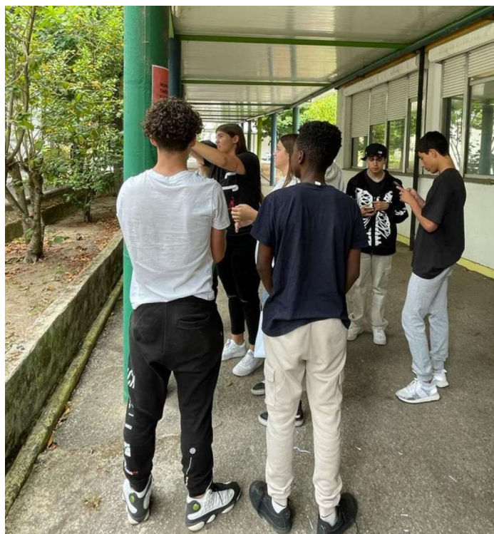
Fotografia 4 - Momento de colagem dos cartazes criados com a turma de 9º ano na Escola Secundária do Lumiar, em Lisboa.

O Laboratório EDxperimental sobre Desenvolvimento Sustentável, decorreu em 2024 com turmas de 11º ano em articulação com a disciplina de Inglês. Este iniciou-se com a realização da dinâmica do “Mural do Clima” 21 . Esta pretende uma apropriação e compreensão sobre as questões climáticas, através da realização de um jogo de cartas que cria ligações entre causas e efeitos e ajuda a compreender os desafios que advêm das alterações climáticas. Neste os/as participantes têm que trabalhar colaborativamente e são também desafiados a trabalhar a criatividade. Depois de melhor compreenderem o que são as alterações climáticas, os e as jovens iniciaram uma investigação para melhor perceberem o que era o ativismo e conhecerem alguns ativistas ambientais. Com base nestas pesquisas os e as estudantes criaram cartazes sobre os ativistas que investigaram, sendo estes cartazes posteriormente colados pela Escola e utilizados num peddy-paper que decorreu no Dia do Agrupamento.