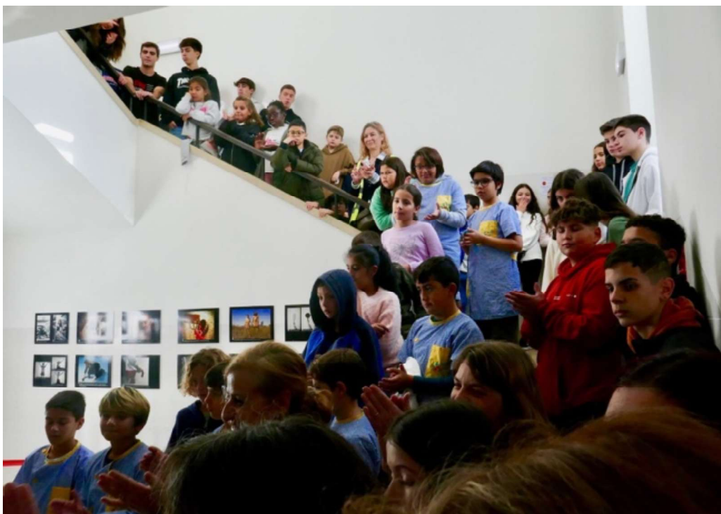
Fotografia 1 - O vão de escadas onde surgiu o Cupas ciDadania , na Escola Secundária João de Deus, em Faro.

Pouco a pouco, o local transformado tornou-se não só num espaço de divulgação e informação sobre as questões de cidadania e as atividades ou projetos desenvolvidos na escola neste âmbito, mas também de criação artística.