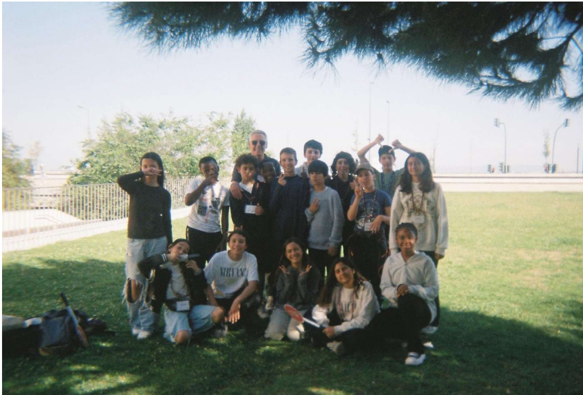
Fotografia 3 - Fotografia no Campo das Cebolas com estudantes de 6º ano durante a visita de estudo “À Lisboa de Abril”, em maio de 2024.

O Laboratório EDxperimental sobre Igualdade de Género, decorreu em 2023 com uma turma de 9º ano a partir da disciplina de Cidadania e Desenvolvimento. Este desenvolveu-se utilizando dinâmicas de promoção de competências socioemocionais, debates e investigações que abordaram temas como os preconceitos e papéis de género, a violência no namoro entre outros. Todas estas atividades culminaram num trabalho colaborativo da turma, de criação de uma campanha de sensibilização sobre as desigualdades de género. Os e as jovens construíram frases pensadas para provocar e fazer refletir a restante comunidade escolar relativamente ao tema trabalhado. Assim os cartazes foram colados no “recreio” como forma também de ocupar o espaço escolar com o trabalho realizado em sala de aula. Esta saída do trabalho dos/as jovens para o espaço escolar trouxe uma valorização do trabalho realizado, sendo a turma criada dos cartazes a zeladora do espaço. Ainda hoje, alguns dos cartazes mantêm-se nos pilares da escola.