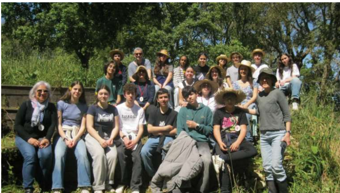
Fotografia 8 - Participantes do Laboratório Juvenil do 9º ano, foto tirada depois do trabalho de limpeza do jardim-labirinto.