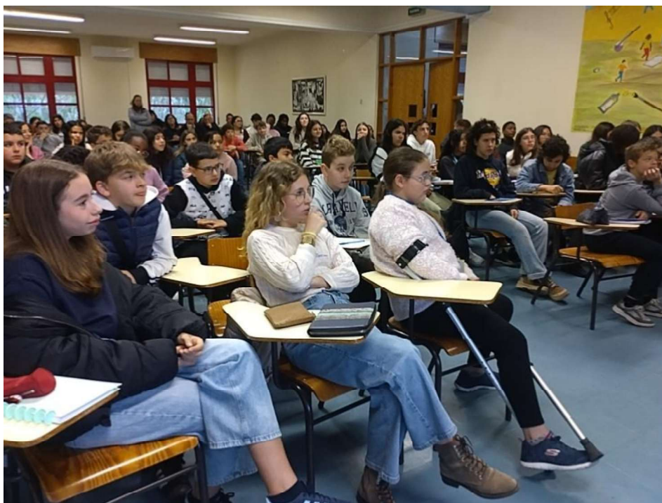
Fotografia 10 - Balanço e encerramento dinamizado pelas duas turmas de 9º ano.

Os grupos, antes de decidirem como iriam realizar a sua atividade, tiveram como desafio identificar pelo menos sete formas criativas para abordar o seu tema. Só depois escolheram uma, havendo opções muito diversas: criar uma música, fazer um vídeo, inventar uma exposição com desenhos e fotografias, construir jogos, etc.