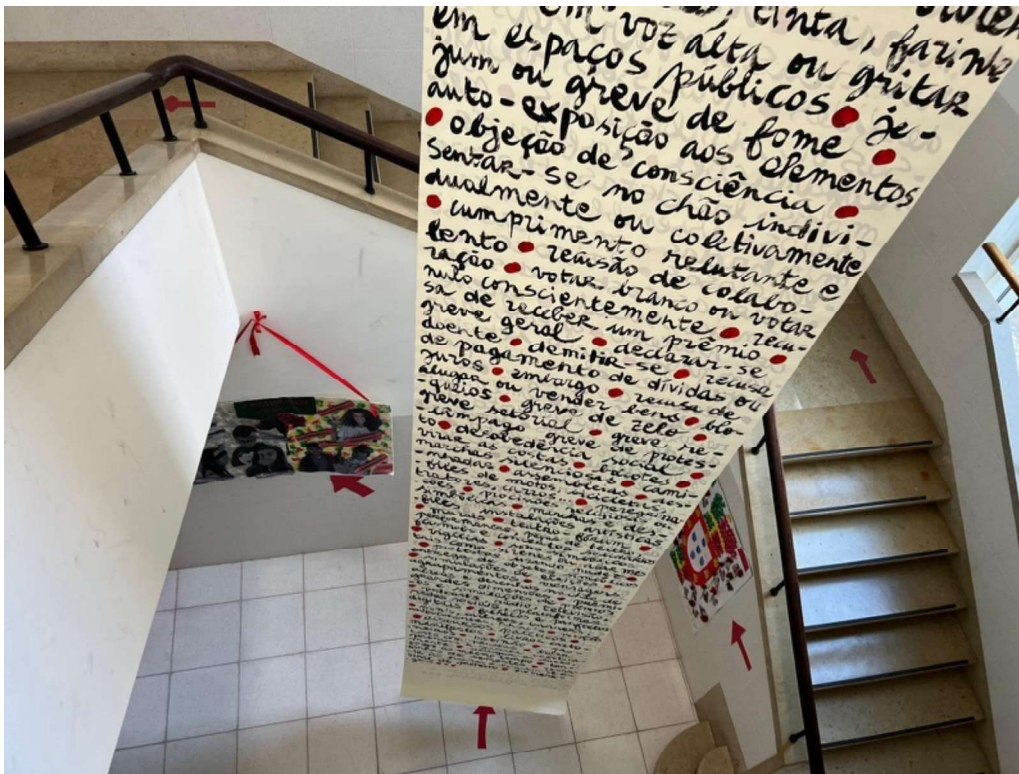
Fotografia 2 - Imagem de uma das exposições que decorreram no oCupas ciDadania na Escola Secundária João de Deus, em Faro.

A partir dessa primeira experiência com uma turma, todas as exposições realizadas no espaço até hoje foram criadas em estreita colaboração com turmas ou grupos de alunos e alunas, quer seja a nível da curadoria, da montagem, da organização, da inauguração e da divulgação. Realizaram-se uma média de 5 exposições temáticas por ano letivo, sendo que a temática da eliminação da violência contra as mulheres (25 de novembro), Direitos Humanos e Holocausto (dezembro/janeiro) e as nossas causas (abril/maio) são temáticas recorrentes todos os anos. As exposições estão, em princípio, inseridas num conjunto de atividades mais amplo, como palestras, performances teatrais, filmes, oficinas, permitindo abordar a temática de uma forma mais abrangente, mais crítica e para um público mais alargado.