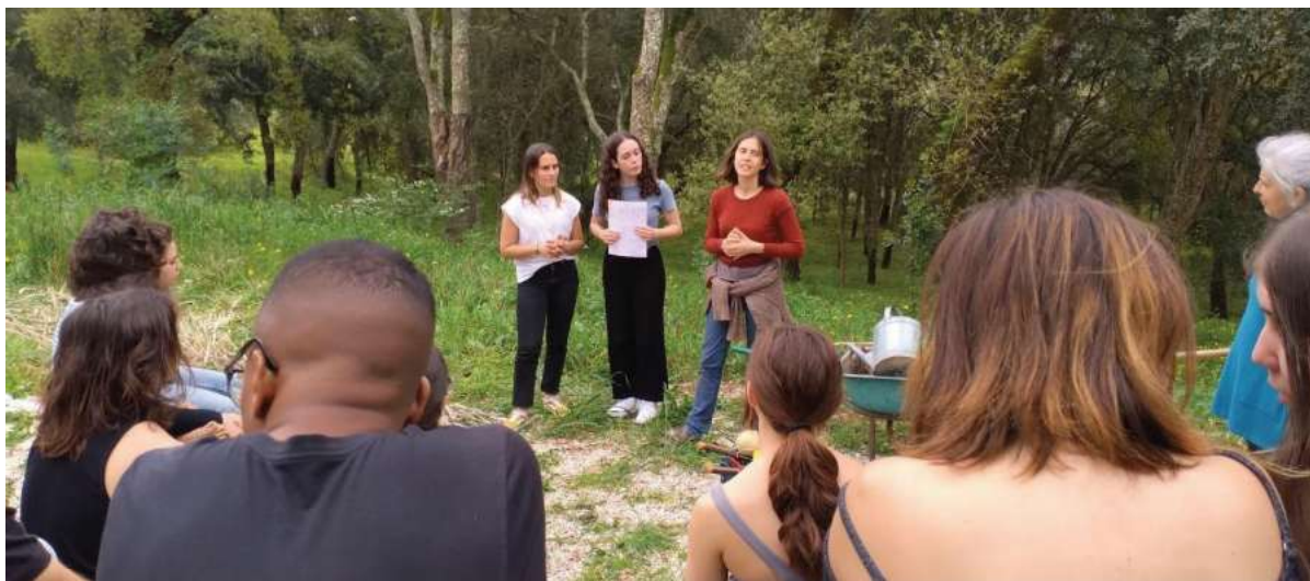
Fotografia 7 - Apresentação do simbolismo do labirinto.

No centro do Labirinto está uma macieira, que simboliza uma árvore da vida, e ao começar o caminho de saída, cada pessoa pensa em formas de irradiar aquilo que recebeu de volta para as pessoas, lugares, projetos que o/a rodeiam. Pensa num compromisso específico, uma conversa, uma atenção, uma ajuda, uma iniciativa específica, que pode pôr em prática na sua terra ou cidade. Aqui vive-se o pilar “Viver Comprometidos e Atentos”.