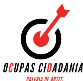
Imagem 1 - Logotipo criado para a galeria escolar.

com ideias de exposições e temáticas a abordar que foram postas em prática. Também existiram docentes a expor de forma mais digna os trabalhos dos seus alunos e alunas e a dar aulas nesse mesmo espaço. Quando a galeria está vazia, a comunidade escolar estranha.