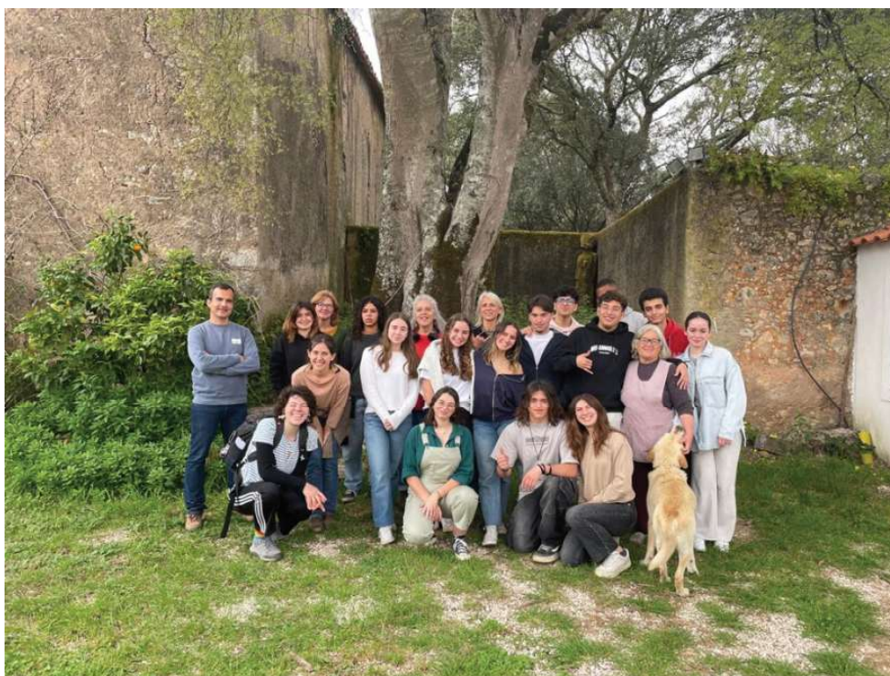
Fotografia 5 - Participantes no Laboratório Juvenil de 12º ano de 2024.

Em março de 2024, estiveram na Quinta da Casa Velha, no Vale Travesso, em Ourém, 13 estudantes do 12º ano da Covilhã e de Faro. Tinham participado no ano anterior num dos Laboratórios Juvenis do projeto EDxperimantar, onde, no final, tinham realizado cartazes em pares ou trios. Desta segunda vez, num novo Laboratório Juvenil em formato residencial, realizaram um trabalho diferente – participaram na plantação de um jardim labirinto, cuja estrutura já estava desenhada.