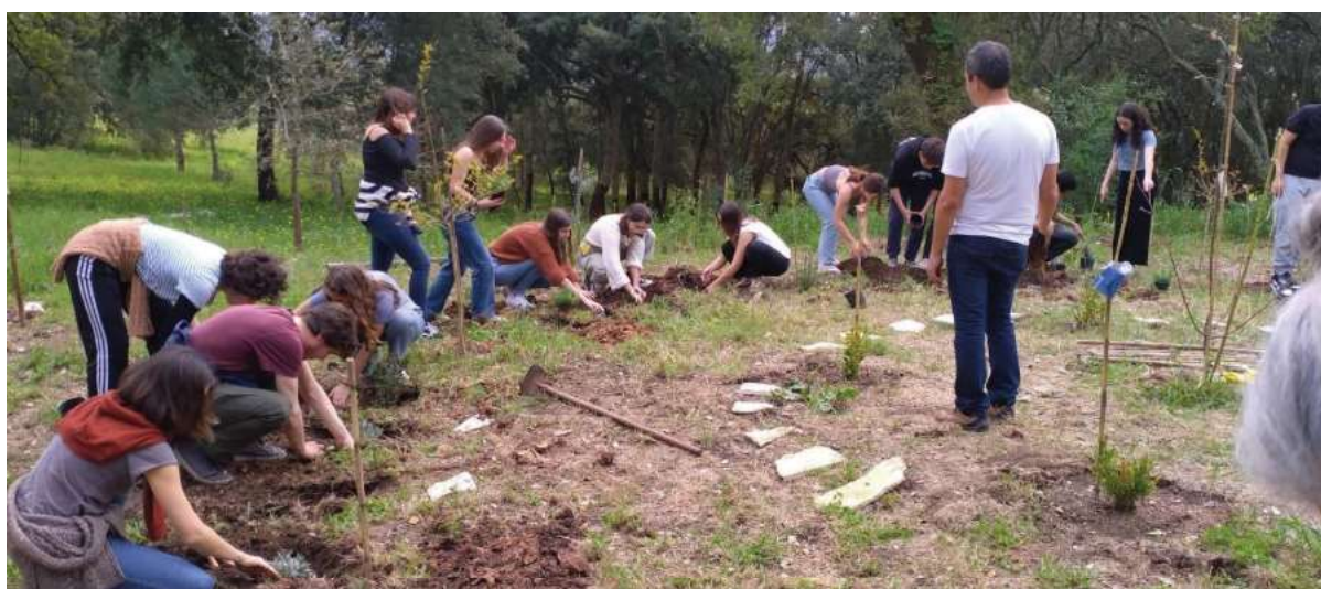
Fotografia 6 - Momento de plantação das árvores e arbustos no jardim-labirinto.

Num primeiro momento foram criados dois grupos: um que pensava no simbolismo do percurso pelo jardim-labirinto e outro que, de mãos na terra, mediu e marcou os lugares onde escavar e plantar os diferentes arbustos ou árvores – alecrins, alfazemas, oliveiras, lagerstroémias. Num segundo momento, cada estudante escavou e plantou um arbusto ou uma jovem árvore, que depois regou.