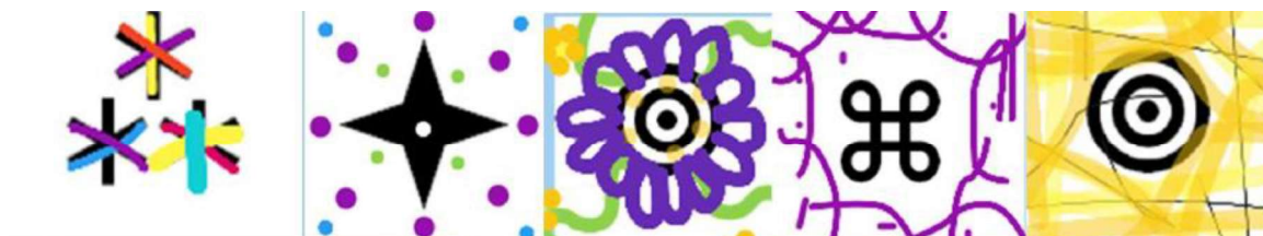
Fotografía 2 - Dibujos de las participantes.

En una segunda ronda, y de nuevo individualmente, cada participante retomó su dibujo e imaginó cómo debería ser una seguridad feminista y/o relevante para las mujeres, dibujando ese cambio sobre su figura abstracta. Se efectuó entonces una segunda ronda explicando qué dibujaron y cómo imaginaban esa seguridad feminista, a modo de futuro deseado.