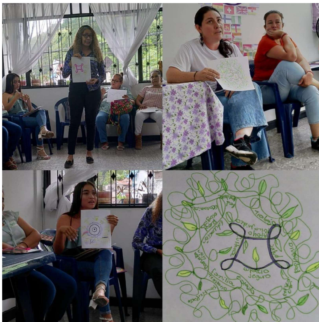
Fotografía 1 - Ronda de intervenciones de las participantes en el taller explicando qué es la seguridad feminista para ellas.

En una segunda ronda, y de nuevo individualmente, cada participante retomó su dibujo e imaginó cómo debería ser una seguridad feminista y/o relevante para las mujeres, dibujando ese cambio sobre su figura abstracta. Se efectuó entonces una segunda ronda explicando qué dibujaron y cómo imaginaban esa seguridad feminista, a modo de futuro deseado.