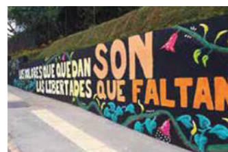
Mural: Los dolores que quedan son las libertades que faltan. Ciudad Universitaria Rodrigo Facio, Montes de Oca. (2018).~