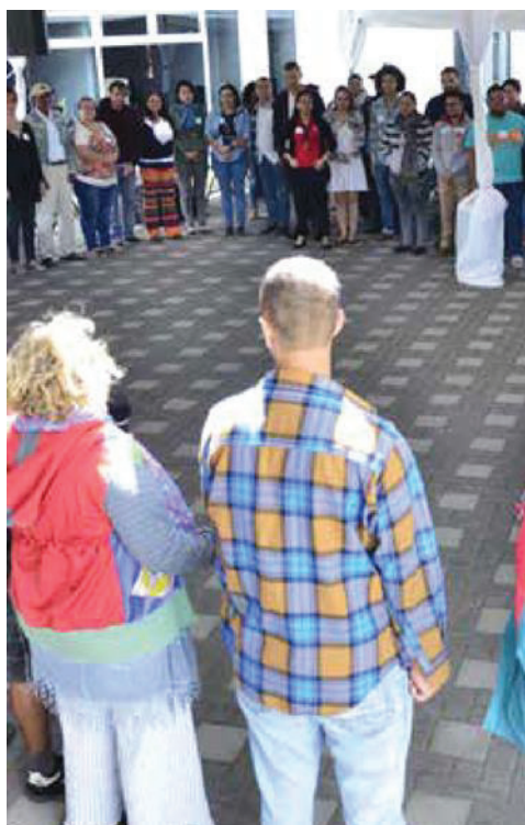
Encuentro de puesta en común del Foro de Acción Social. Edificio de Ciencias Sociales Universidad de Costa Rica. (Diciembre, 2017)

Hoy, desde Costa Rica, en este abril del 2018, sumamos nuestras voces a las voces estudiantiles de la Universidad de Córdoba, quienes lucharon por la universidad sin ataduras que todavía hoy soñamos. Prolongamos sus voces en nuestras voces, con la esperanza de que en nuestro concepto actual y futuro de universidad, la acción social brille como praxis defensora e impulsora de una educación pública para todas las personas. Defendamos las universidades públicas y la acción social porque aunque “Los Dolores que quedan son las libertades que faltan” nos sobran manos, paredes, miradas para reescribir nuestra historia, nos sobran el viento, la luz, la tierra, para sembrar certidumbres y arrebatarse verdades, nos sobra el movimiento para no estancarnos y dar todo por ganado.